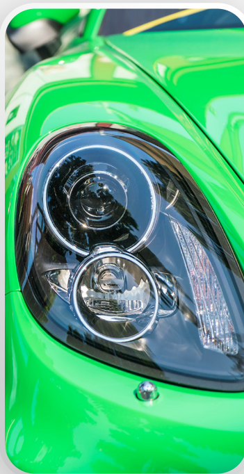
Linh kiện ô tô